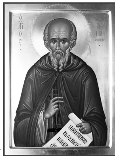
Преподобный Антоний Сийский. Сийская иконописная мастерская.

Святитель Николай родился в городе Патаре области Ликии (Малая Азия). Еще в детстве начал строгую подвижническую жизнь, проводя все время в чтении Священного Писания, в подвигах поста и молитвы. Видя его добродетельную жизнь, епископ посвятил его в священники, затем Николай был избран епископом города Миры. Святитель прославился великой ревностью к истинной вере и милосердием к людям. Еще при жизни творил чудеса милосердия, воскрешал умерших, снабжал хлебом голодных, спасал терпящих бедствие. После смерти получил от Бога такой дар чудотворений, что стал самым почитаемым в мире святым. На Руси множество соборов, монастырей и церквей посвящено его святому имени.