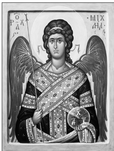
Архангел Михаил. Сийская иконописная мастерская.

Преподобный Варлаам — один из основателей монашества в северной Руси. Родился в 1156 году в Новгороде. Уже в юности возлюбив иноческое житие, он по смерти родителей раздал имущество бедным и принял монашеский постриг. Желая подвизаться в уединении, удалился в местечко Хутынь, построил келью, всецело предан молитве, посту и трудам. Слава о его подвигах разлетелась по округе, и к нему стали приходить люди за духовным наставлением, многие желали пустынного жития под его руководством и селились возле него. Преподобный устроил для них обитель во имя Преображения Господня. Будучи настоятелем монастыря, подавал высокий пример добродетели. По молитвам ко Господу совершил много чудес.